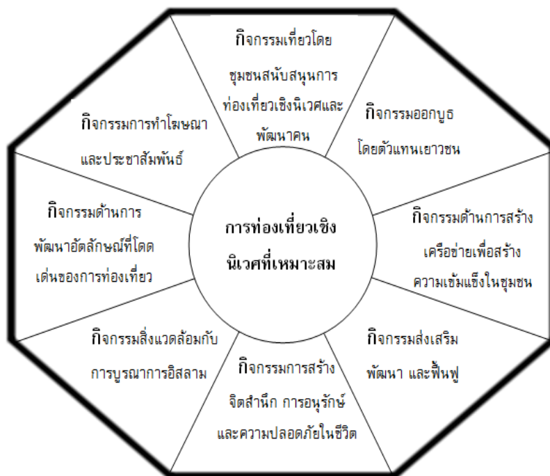
ภาพที่ 1 รูปแบบกิจกรรมในการจัดการการท่องเที่ยวเชิงนิเวศที่เหมาะสมภายใต้กรอบความร่วมมืออาเซียน

8) ก. ที่แปด กิจกรรมเที่ยวโดยชุมชนเพื่อสนับสนุนการท่องเที่ยวเชิงนิเวศและพัฒนาคน เช่น มีกระบวนการในการจัดการความรู้ภายในชุมชน มีการพัฒนาทักษะและเพิ่มเติมความรู้ใหม่ให้กับสมาชิกในชุมชนในการบริหารจัดการท่องเที่ยวเชิงนิเวศสร้างความมั่นใจในการพูดคุยแลกเปลี่ยนกับคนภายนอก