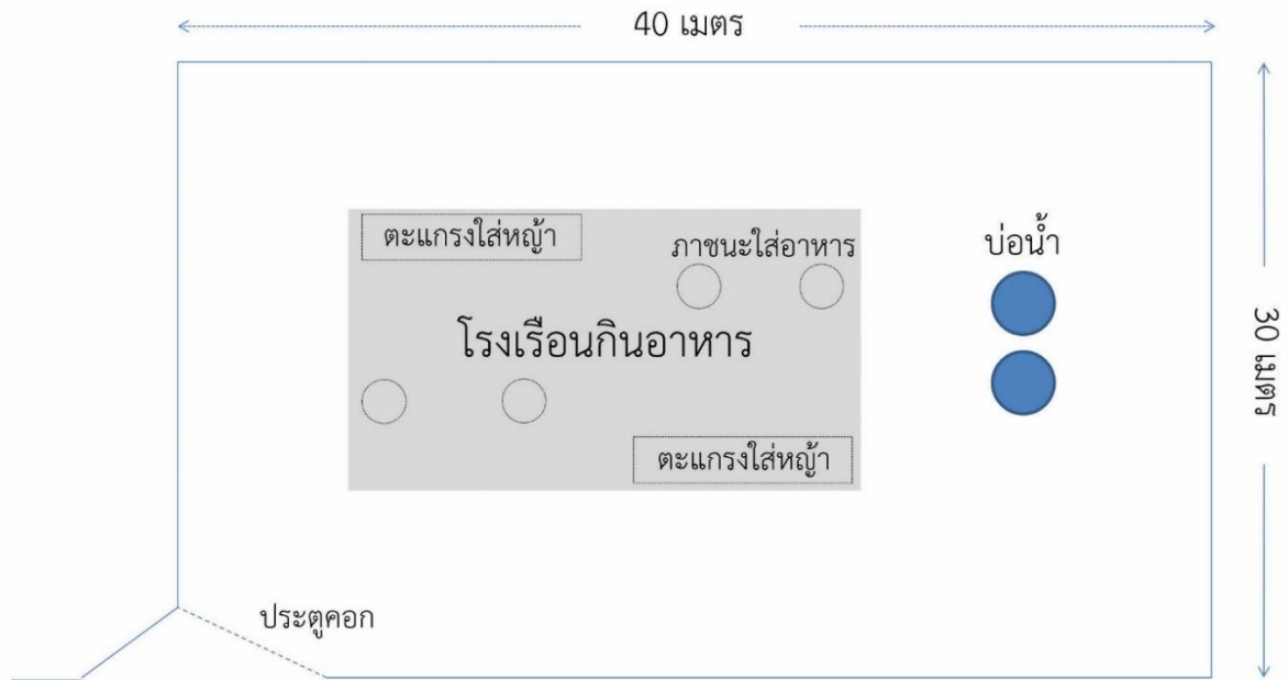
ภาพที่ 1 แผนผังคอกเลี้ยงกวางมาตรฐาน (ออกแบบโดยผู้ช่วยศาสตราจารย์พรชัย วงศ์วาสนา)