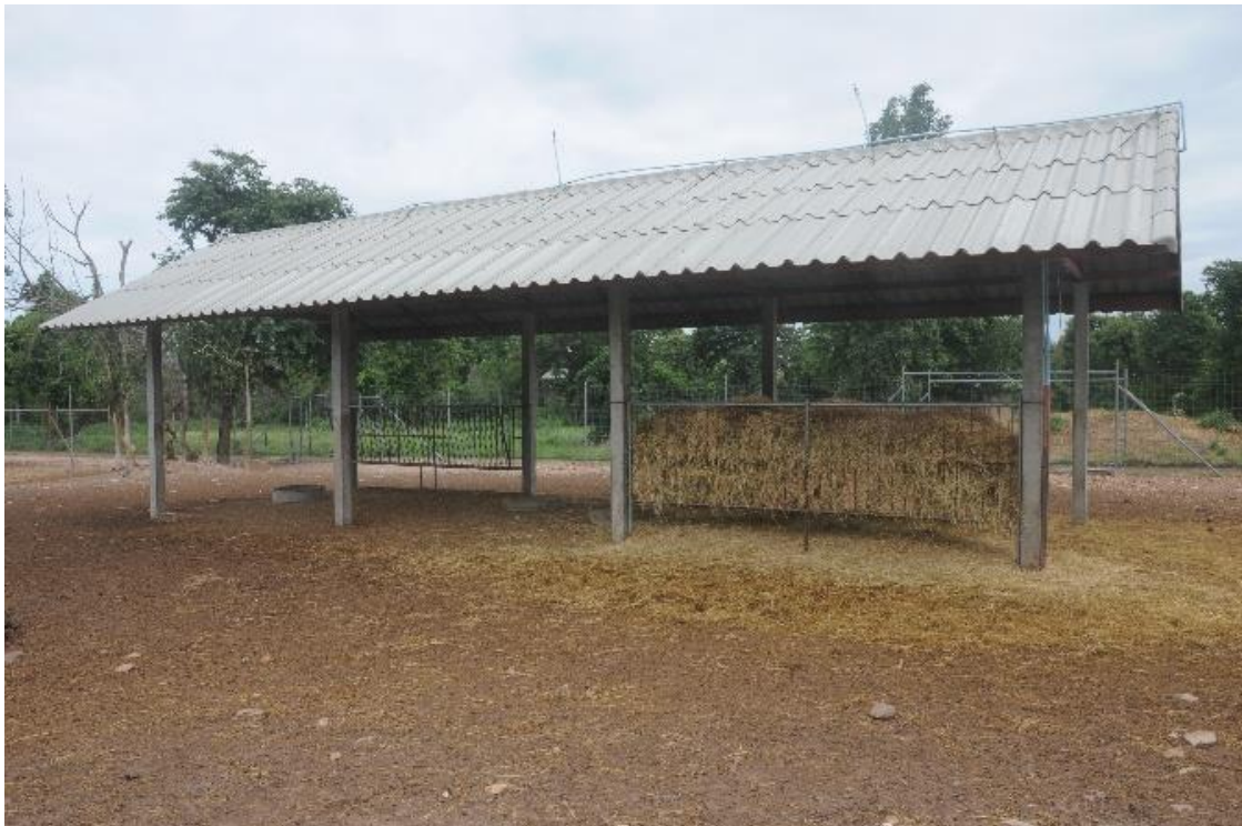
ภาพที่ 2 โรงเรือนให้อาหาร (ออกแบบโดยผู้ช่วยศาสตราจารย์พรชัย วงศ์วาสนา)