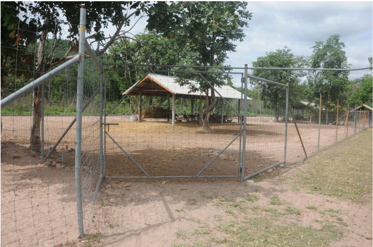
ภาพที่ 7 ลักษณะประตูทางเข้าออกคอกเลี้ยงกวางมาตรฐาน ที่ออกแบบเป็นประตูเฉียงมีพื้นที่เหลือให้กวางหลบหลีกจากคนเลี้ยง (ออกแบบโดย ผู้ช่วยศาสตราจารย์พรชัย วงศ์วาสนา)