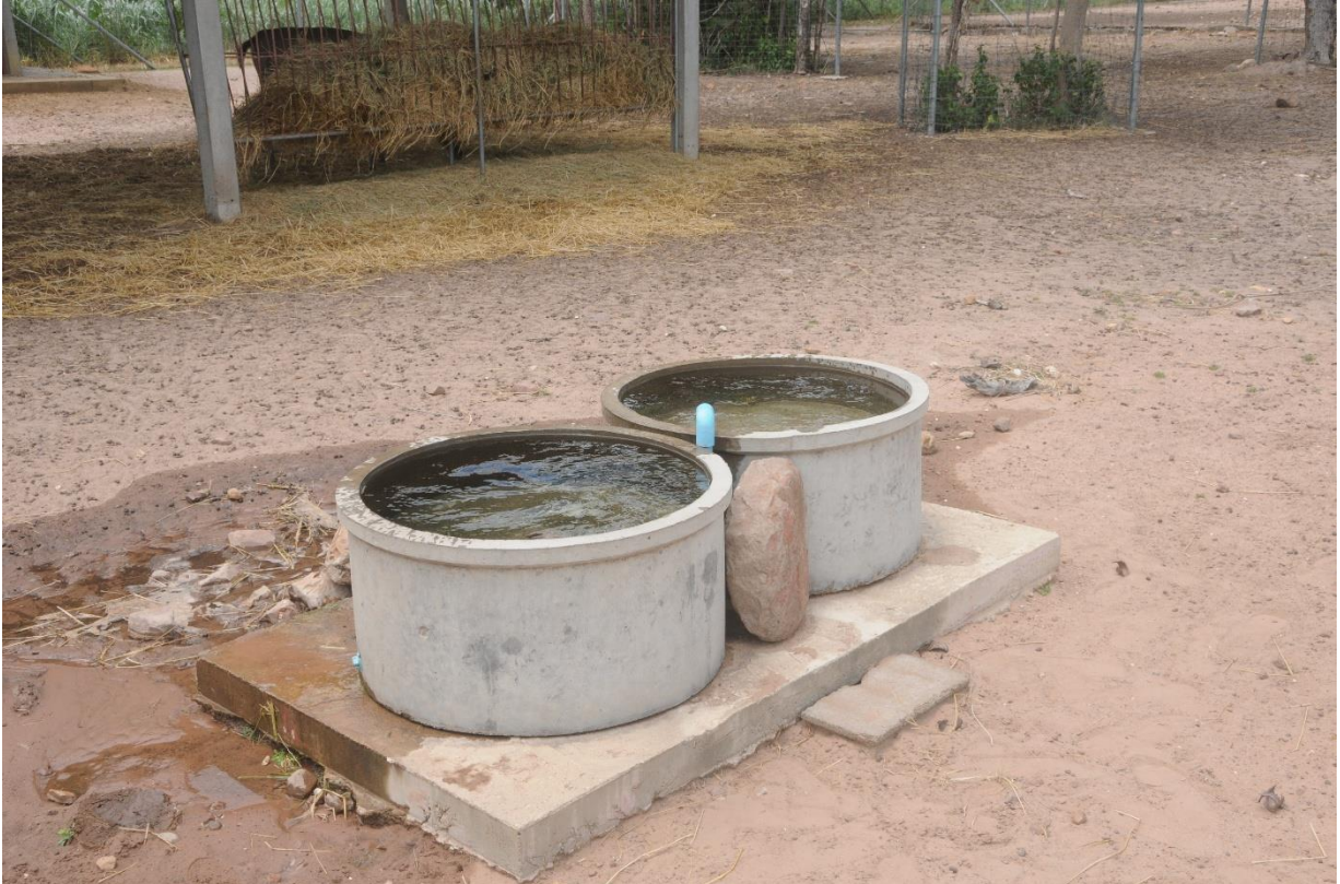
ภาพที่ 6 บ่อน้ำซีเมนต์ที่ติดตั้งไว้รองรับการใช้น้ำของฝูงกวาง ออกแบบเป็นวงคู่ในคอกเลี้ยงกวางมาตรฐาน (ออกแบบโดย ผู้ช่วยศาสตราจารย์พรชัย วงศ์วาสนา)