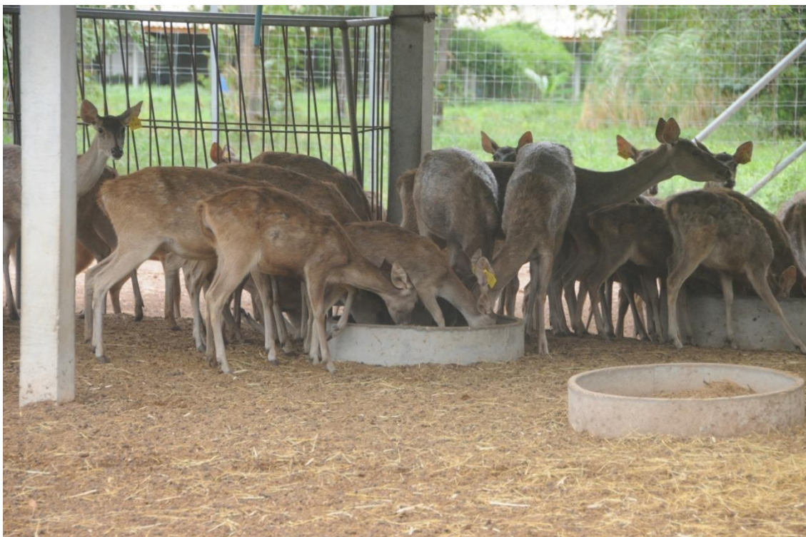
ภาพที่ 3 ภาชนะใส่อาหารผสมสำเร็จรูป ออกแบบการวางในจุดต่าง ๆ ในคอกเลี้ยงกวางมาตรฐาน (ออกแบบโดยผู้ช่วยศาสตราจารย์พรชัย วงศ์วาสนา)