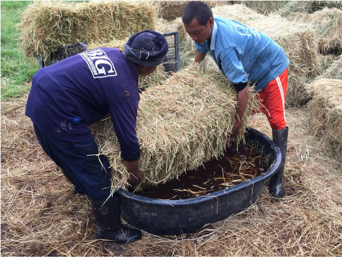
ภาพที่ 2 การเตรียมฟางข้าวให้กวางกิน (ฟาร์มกวางมหาวิทยาลัยรามคำแหง จังหวัดสุโขทัย)