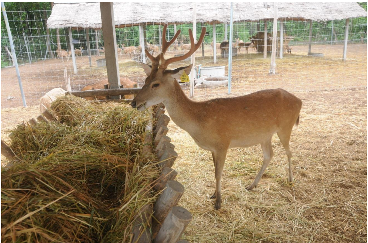
ภาพที่ 6 กวางซีกกำลังกินฟางข้าว (ฟาร์มกวางมหาวิทยาลัยรามคำแหง จังหวัดสุโขทัย)