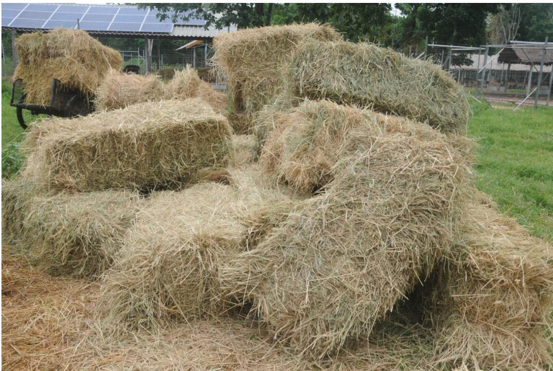
ภาพที่ 1 ฟางข้าวที่ใช้ทดลองให้กวางกิน (ฟาร์มกวางมหาวิทยาลัยรามคำแหง จังหวัดสุโขทัย)

5. คำนวณราคาอาหารแต่ละชนิด ปริมาณอาหารที่กวางกินในแต่ละตัว คิดเฉลี่ยเป็นค่าอาหาร/ตัว/วัน (ตารางที่ 1 และตารางที่ 2 ข้อมูลของกวางรูซ่า/ ตารางที่ 3 และตารางที่ 4 ข้อมูลของกวางซีก้า)