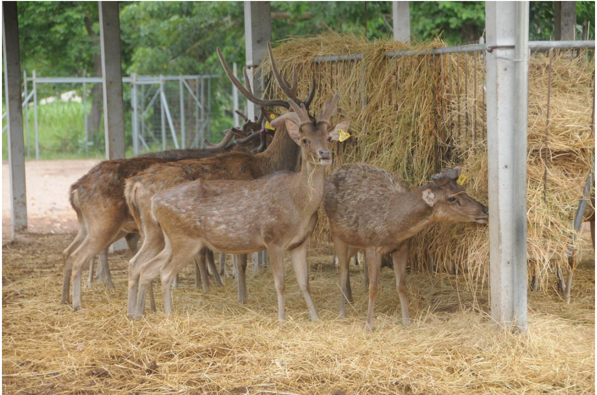
ภาพที่ 5 กวางรูซากำลังกินฟางข้าว (ฟาร์มกวางมหาวิทยาลัยรามคำแหง จังหวัดสุโขทัย)